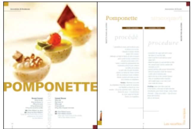
60 recettes de dessert avec photo

Format 240 x 330 mm 180 pages Édition bilingue français/anglais