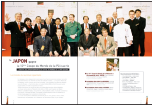
Rétrospective du concours par année (Photo de groupe et lauréats)